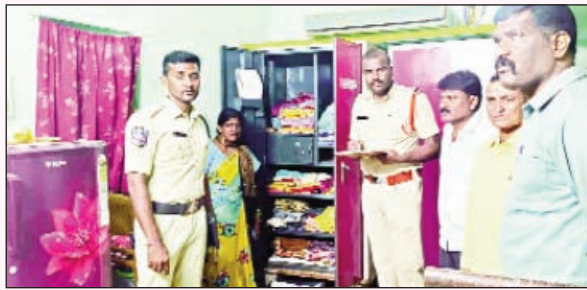
రఘునాథపల్లి, ఏప్రిల్ 8 ప్రభాతవార్త :