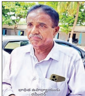
లంచం అడిగినదాని గురించి వివరిస్తున్న భాధిత ఉపాధ్యాయుడు