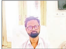
తరిగొప్పుల, ఏప్రిల్ 8 ప్రభాతవార్త :

అనుమతులు లేనిది ఎలాంటి ఇసుక, మట్టి అనుమతి లేదని తరిగొప్పుల మండల తహసీల్దార్ మోసిన అన్నారు. తరిగొప్పుల మండలకేంద్రంలో తహసీల్దార్ కార్యాలయంలో మాట్లాడుతూ ఎటువంటి అనుమతులు లేకుండా మొరం, అక్రమ ఇసుక రవాణా చేసినా వారిపై తగుచర్యలు తీసుకుంటామని హెచ్చరించారు. ఎలాంటి అనుమతులు కావాల్సినా వారందరూ తహసీల్దార్ కార్యాలయంలో సరైన పత్రాలు అందజేసి అనుమతులు తీసుకోవాలని, వారికి వెంటనే అనుమతులు అందిస్తామని తెలిపారు. అలాగే మండల కేంద్రంలో ఇటుక బట్టీలకు మట్టికి ఎలాంటి అనుమతులు లేవని, అతిక్రమించిన చట్టప్రకారం వారిపై తగుచర్యలు తీసుకుంటామని హెచ్చరించారు. నిబంధనల ప్రకారం ప్రజలందరూ సహకరించాలని తెలిపారు. ప్రజలకోసమే తాము పనిచేస్తామని ఎలాంటి ఒత్తిడిలకు లొంగమని తెలిపారు.