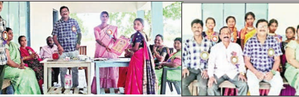
నర్సెట్ల, ఏప్రిల్ 8 ప్రభాతవార్త :